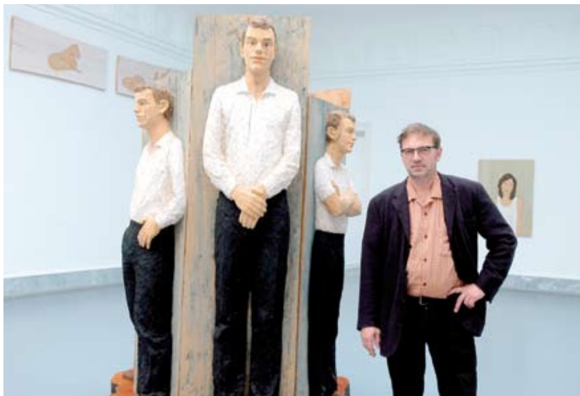
Der Bildhauer Stephan Balkenhol mit seiner Sechsergruppe

Als der Künstler Ende der 70er Jahre die menschliche Figur für sich wieder entdeckte, witterten seine Künstlerkollegen Verrat: sie glaubten an die lineare Entwicklung, an einen Fortschritt in der Kunst hin zum Abstrakten: “Aber irgendwann lief sich das tot, die Kunst reflektierte sich nur noch selbst. Ich wollte nicht nur Kunst über Kunst machen, sondern die Welt reinlassen.” Balkenhol geht es weder um naturalistische Nachahmung noch um die expressionistische Geste. “Mich interessieren zwei Dinge, die sich eigentlich ausschließen: der Mensch, also seine Gestalt, Haltung, Gestik und Mimik. Aber auch die Offenheit der Figur.” So stellen seine “universellen Menschenbilder” zwar keine konkreten Individuen dar. Weil sie aber menschliche Grundeigen-schaften spiegeln, kann der Betrachter sich in ihnen dennoch wieder erkennen.