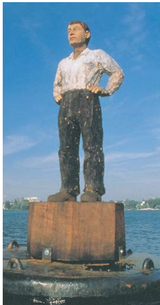
Eine der vier Bojenfiguren in Hamburg, 1993 Neeb, Hamburg

Abschließend sei angemerkt, dass Giraffen schon seit der Antike unter ganz ähnlichen Umständen wie bei dieser von ARTE und der Stadt Straßburg gemeinsam initiierten Ausschreibung eine Rolle gespielt haben: Die sonderbare Eleganz dieser Tiere, die alle anderen an Höhe überragen, ließ sie zu einem hochgeschätzten Gastgeschenk werden. Herrscher bedachten sich gegenseitig mit diesem besonderen Wesen, das bald zur Hauptattraktion in Tierparks und zoologischen Gärten wurde. So schenkte der ägyptische Vizekönig Mohammed Ali 1827 Karl X. eine Giraffe zu Ehren der französisch-ägyptischen Freundschaft. Auf seiner Reise von Marseille nach Paris rief das Tier allerorten bei Eliten wie bei einfachen Menschen größtes Erstaunen hervor.