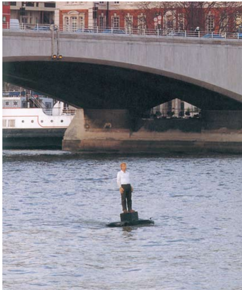
BOJENFIGUR , 1992 in London Gekauft von Hamburg 1993

Weniger bekannt sind seine Bronzeskulpturen. Was auf den ersten Blick herkömmlich anmutet, wird vom Künstler in Analogie zu seinen Holzarbeiten durch die Verwendung von Farbe auf subtile Art und Weise aufgewertet.