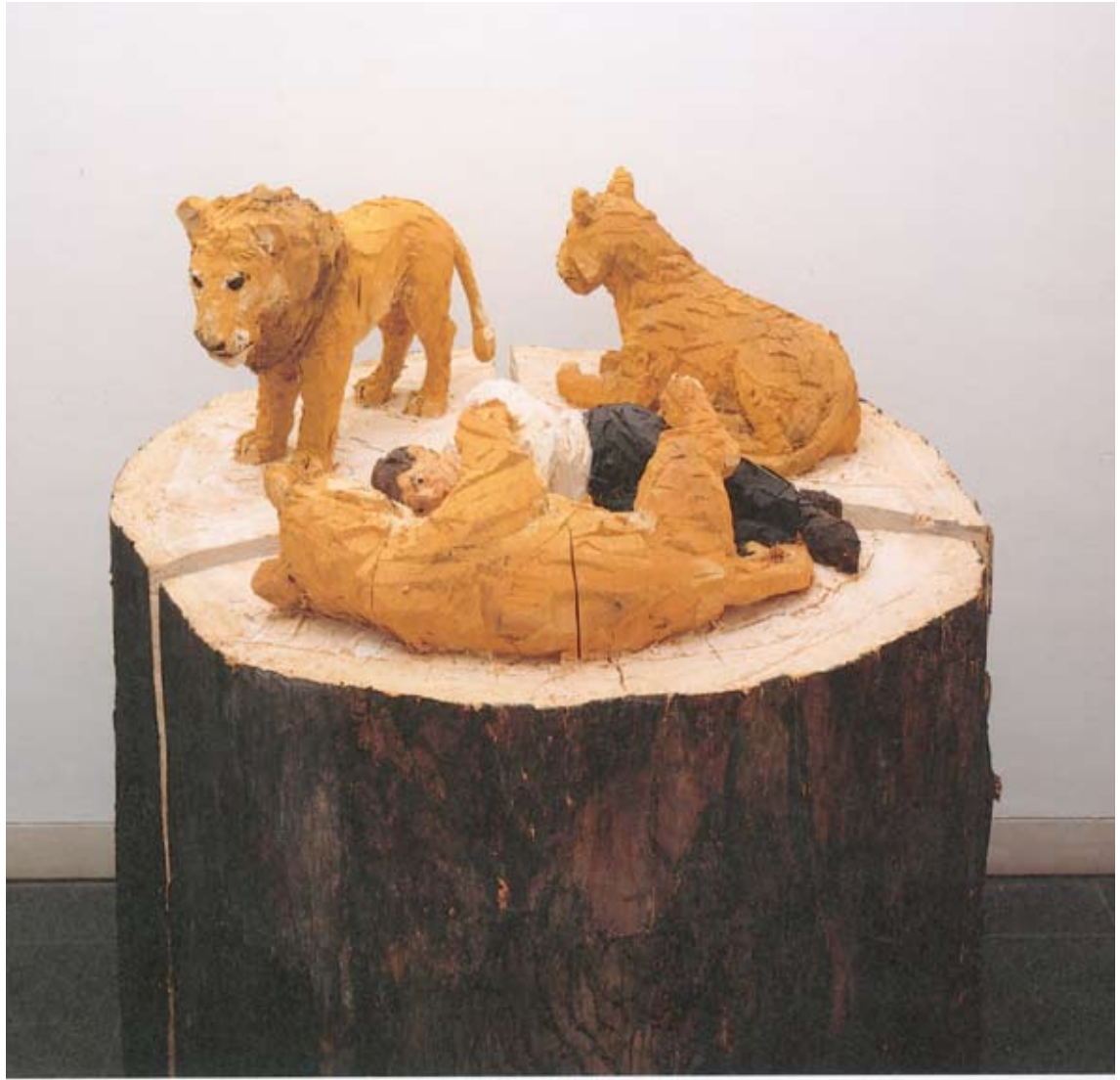
MANN MIT LÖWEN , 1994 Horst+Vivien Schmitter Sammlung, Hamburg

Aus diesem Grund vermutlich machte die Giraffe die abendländische Welt im Gegensatz zu anderen Tieren nie zum Sinnbild einer moralischen Tugend, sondern sie wurde unter rein ästhetischen Gesichtspunkten immer nur als faszinierendes, exotisches Wunder der Natur betrachtet und für ein Mischwesen aus Kamel und Leopard gehalten, wie der lange gebräuchliche Name "Camelopardalis" verrät. Diesen Besonderheiten ist es wohl zu verdanken, dass die Giraffe Eingang in Stephan Balkenhol's bildhauerisches Schaffen gefunden hat. Denn ohne in expressionistischem Pathos oder banale