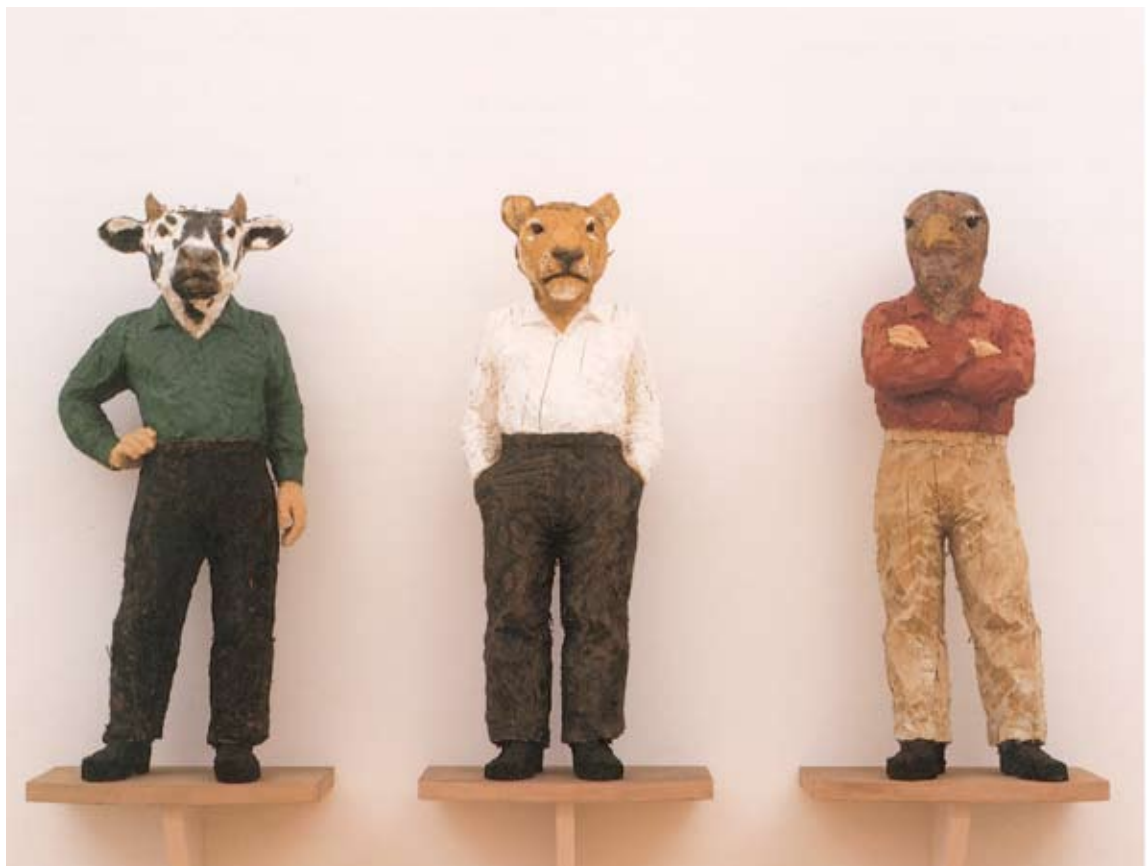
DREI HYBRIDEN, 1995 cat. no. 30, Smithsonian Institution

Ausstellung POSSIBLE WORLDS in London im Jahr 1990 sprach Balkenhol über sein Interesse an der ägyptischen Bildhauerkunst. Auch sie ist reich an Hybridwesen, wie beispielsweise die Sphinx oder tierköpfige Götter, die häufig auf Wandmalereien oder - wie auch im Falle dieses Auftrags - in den Eingangsbereichen zu großen Gebäuden anzutreffen waren: “Mich fasziniert ihre Aura der Ewigkeit und der Stille. Sie scheinen beides in sich zu vereinen. Sie vermitteln den Eindruck von Transzendenz, Realität und Gegenwart - sie haben beinahe etwas Zeitgenössisches. Obwohl sie nicht den gleichen Realismus aufweisen wie die römischen Skulpturen, die eher dreidimensionalen Fotografien ähneln.”