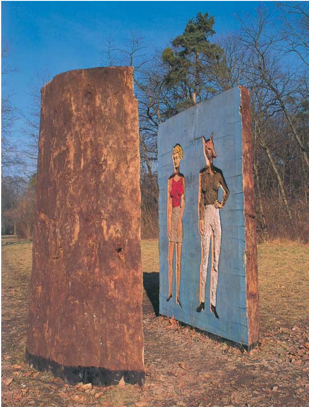
A TRAVERS L'ARBRE/DURCH DEN BAUM , 1995, in Auftrag gegeben vom CEAAC, Parc de Pourtalès, Straßburg.