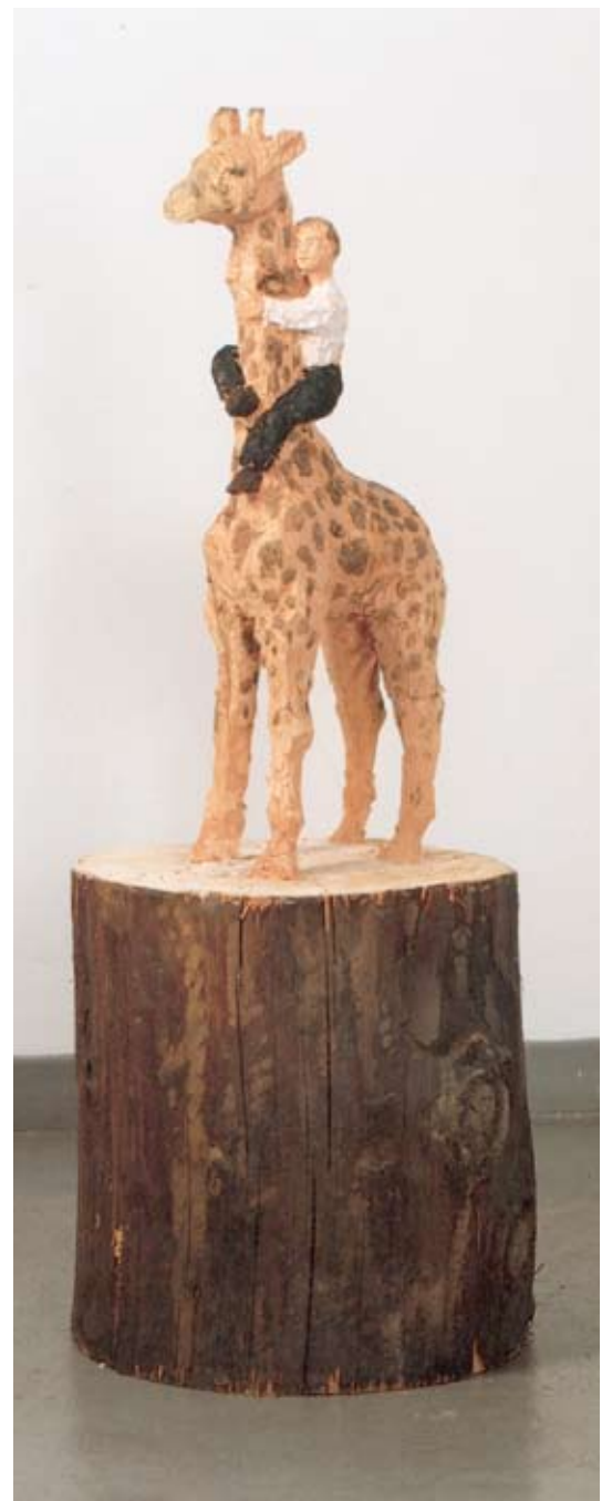
KLEINER MANN AUF EINER GIRAFFE , 1990 Galerie von Braubehrens, München

Menschen nichts mehr mit den natürlichen Maßen zu tun - unverkennbar finden sich Anklänge daran in Balkenhols Werk. Zwar ist die Giraffe das größte auf dem Land lebende Säugetier, doch nie wurde ihr, wie etwa dem Löwen, eine aggressive Haltung gegenüber dem Menschen zugeschrieben; andererseits sagte man ihr aber auch keine besonders menschenfreundliche Gesinnung nach wie beispielsweise dem Delfin.