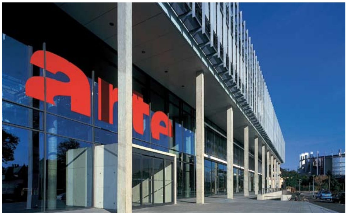
Hauptfassade des ARTE-Sitzes in Straßburg Architekt: Hans Struik

Doch gerade der figurative Aspekt war eines der wichtigen Kriterien für die Auftragsvergabe. Er stellt nicht nur die formale Wahrnehmbarkeit des Kunstwerks sicher, das sich von den eher abstrakten, stark geometrischen Bauten des Europäischen Viertels in seiner unmittelbaren Nachbarschaft abheben soll, sondern ermöglicht auch einer nicht spezifisch vorgebildeten Öffentlichkeit den direkten, unkomplizierten Zugang zur aktuellen Kunst - man denke nur an die zahlreichen Touristen, die auf den Aussichtsbooten am ARTE-Gebäude vorbeifahren.